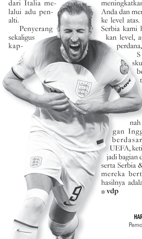
HARRY KANE Pemain Inggris

ten Inggris Harry Kane yakin pengalaman bermain di Bundesliga berguna dalam menghadapi Piala Eropa 2024. Kane bergabung dengan Bayern Munich sejak tahun lalu. Meski gagal meraih trofi di musim pertamanya, namun ia mampu mencetak 44 gol dalam 45 laga, yang menjadi catatan terbaik dalam kariernya sejauh ini.