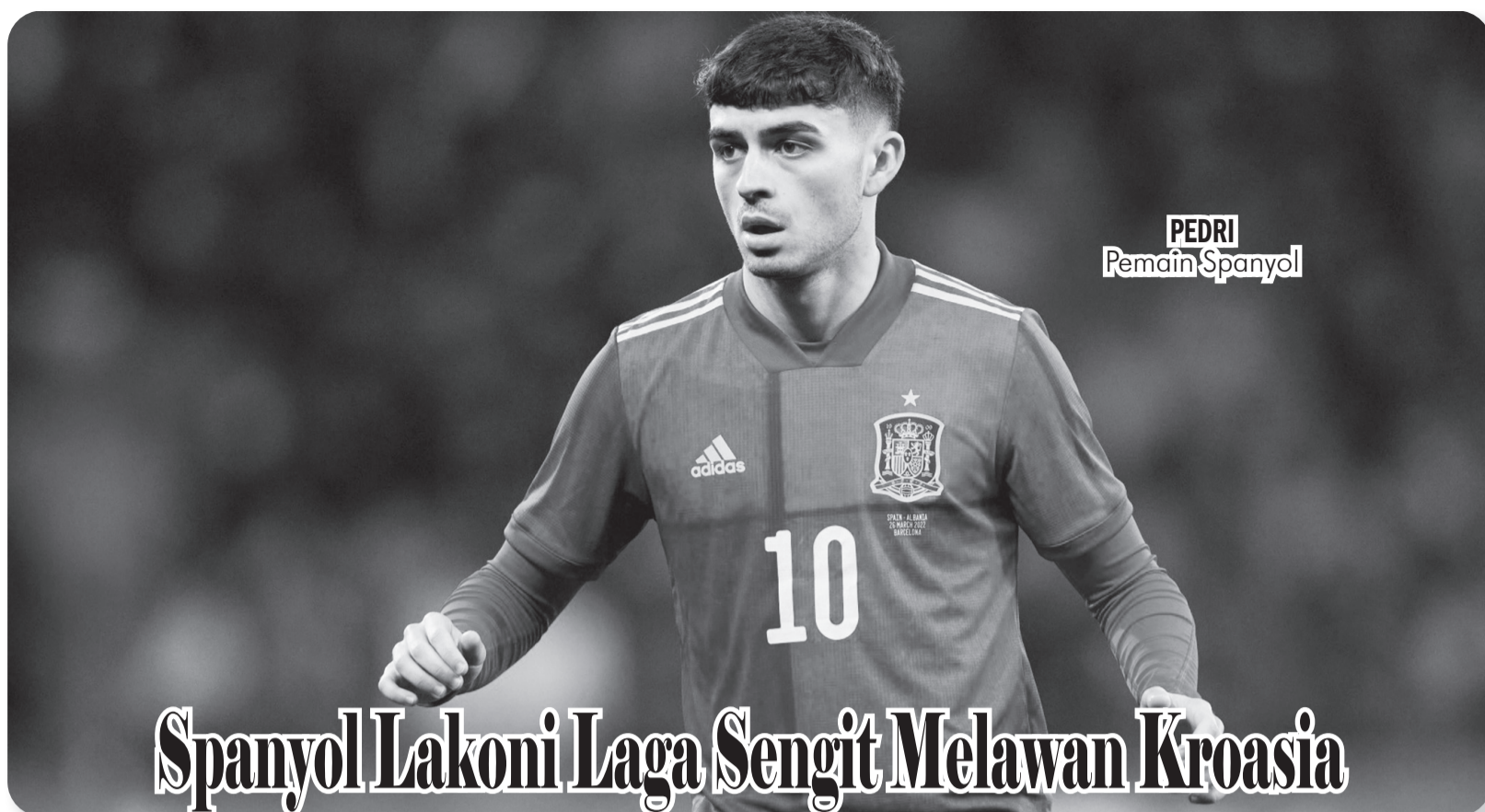
PEDRI Pemain Spanyol