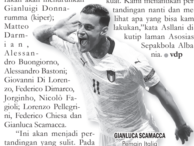
GIANLUCA SCAMACCA Pemain Italia

"Bagi saya, Italia adalah salah satu tim nasional terkami. Kami tahu apa yang harus dilakukan dan kami punya modal lini tengah yang kuat. Kami menantikan pertandingan nanti dan melihat apa yang bisa kami lakukan," kata Asllani dikutip laman Asosiasi Sepakbola Albania. ● vdp